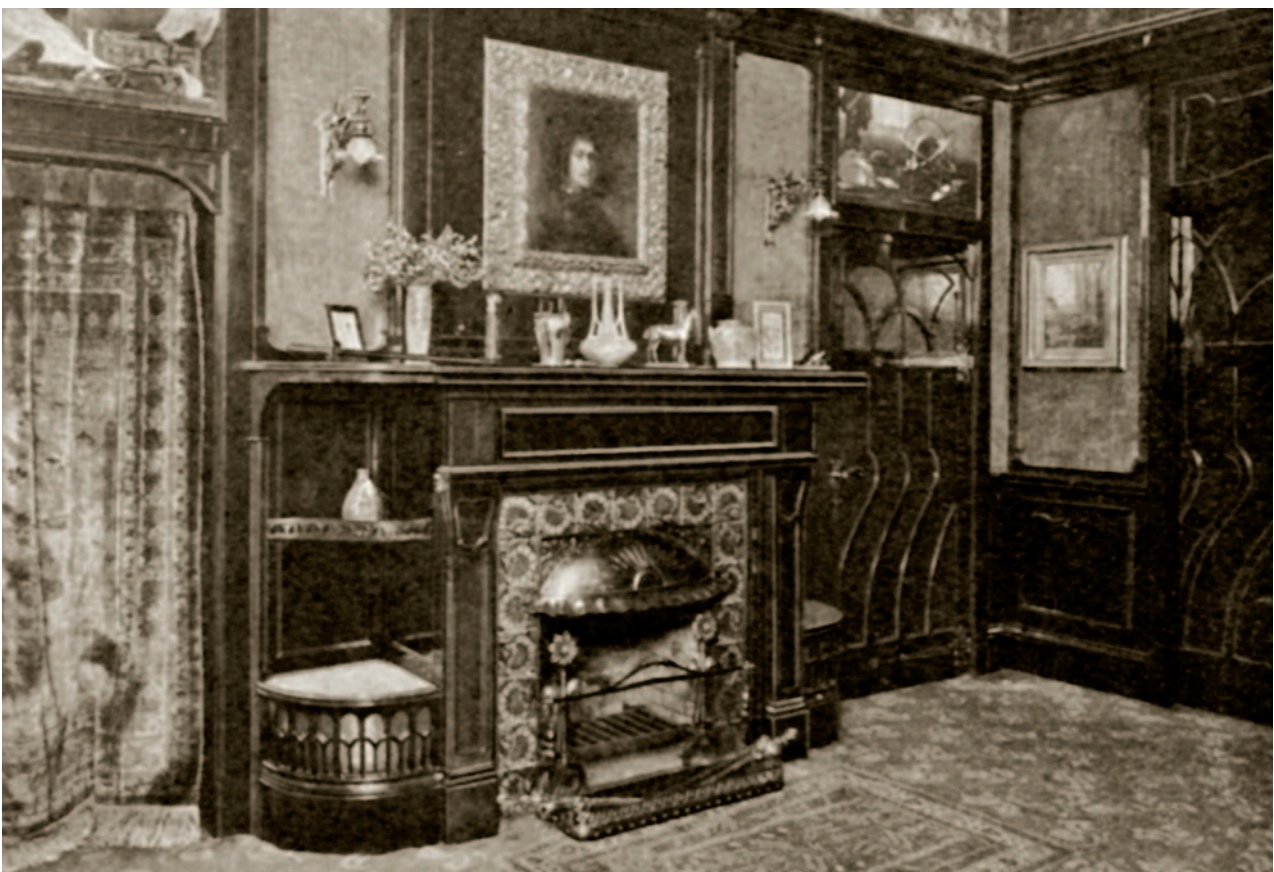
Pohled do interiérů Záměčku v roce 1900. Na horním snímku je ginzkeyovská jídelna a na dolním pak pánský pokoj. Těžký nábytek, drahé obrazy a starožitnosti – to vše mělo spoluvytvářet náladu prostor hodných velkoburžoazie. Zde patrně Alfred se členy své rodiny a možná i obchodními partnery domlouval další rozvoj po otci zděděného kobercového impéria.