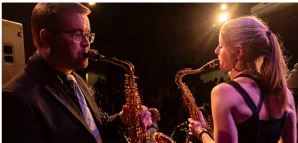
Reprezentační balonkový ples